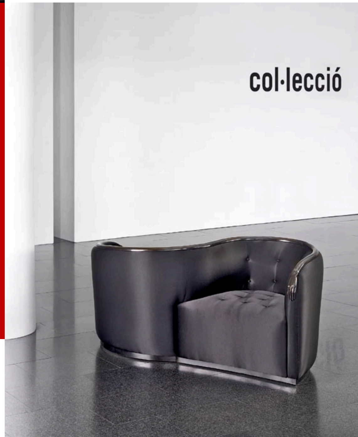
Cajones i Mulates z Black Label Collection.