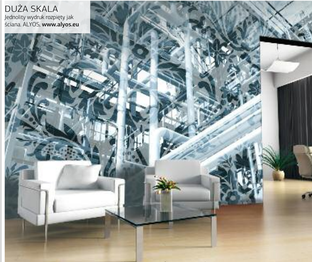
DUŻA SKALA Jednolity wydruk rozpięty jak ściana. ALYOS, www.alyos.eu