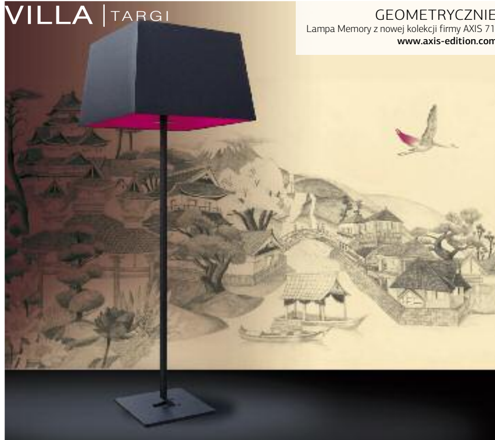
GEOMETRYCZNIE Lampa Memory z nowej kolekcji firmy AXIS 71, www.axis-edition.com