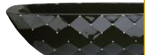
KĄPIEL W KRYSTAŁACH Wanny z najnowszej kolekcji marki Aquamass, ozdobione kryształami. Efekt współpracy z firmą Swarovski. AQUAMASS, www.aquamass.com