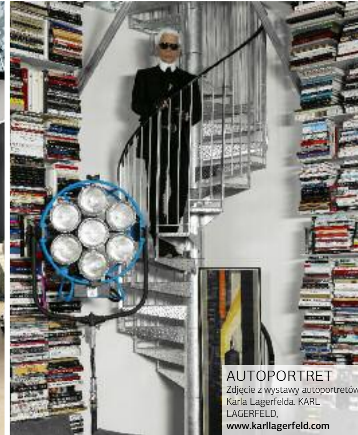
AUTOPORTRET Zdjęcie z wystawy autoportretów Karla Lagerfelda. KARL LAGERFELD, www.karllagerfeld.com