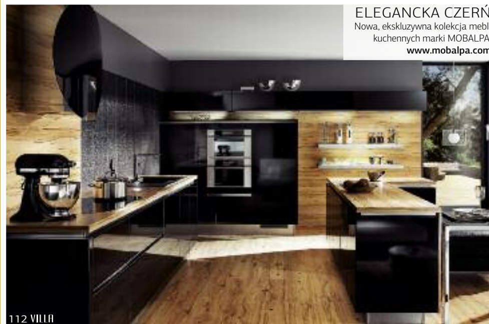
ELEGANCKA CZERŃ Nowa, ekskluzywna kolekcja mebli kuchennych marki MOBALPA, www.mobalpa.com