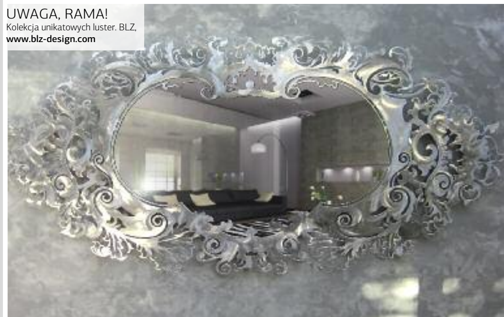
UWAGA, RAMA! Kolekcja unikatowych luster. BLZ, www.blz-design.com