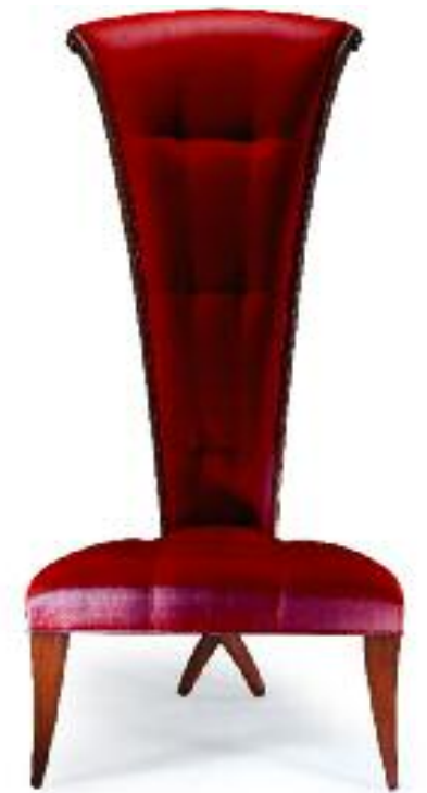
SKRZYŻOWANE Fotel z charakterystycznymi dla Christophera Guya, skrzyżowanymi tylnymi nogami CHRISTOPHER GUY, www.christopherguy.com