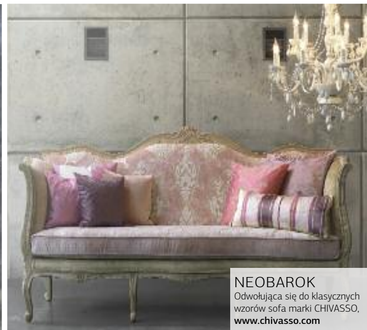
NEOBAROK Odwołująca się do klasycznych wzorów sofa marki CHIVASSO, www.chivasso.com

Nie bez przyczyny hasłem przewodnim targów jest myśl – Paryż Stolicą Światowej Kreacji. Wszystkie dziedziny sztuki mieszają się tu w jednym: fotografia, moda, kulinaria, malarstwo, rzeźba etc. Swoje ekskluzywne aranżacje wnętrz i produkty prezentowały między innymi takie firmy jak: Fendi, Kenzo, Baccarat, Antonio Lupi. Twarzą targów był Karl Lagerfeld, który zaprezentował między innymi serię autoportretów. Paryskie targi to 3200 wystawców, 168 000 mkw. powierzchni wystawowej i ponad 100 000 odwiedzających profesjonalistów. Nowinki technologiczne wplecione zostały przez znanych twórców w nowe i klasyczne formy oraz materiały. Cały czas pozycję wiodącą zajmuje piękno stylu glamour – błysk nowego baroku i gotyku; pojawia się również styl, który można określić „prosto z natury”.