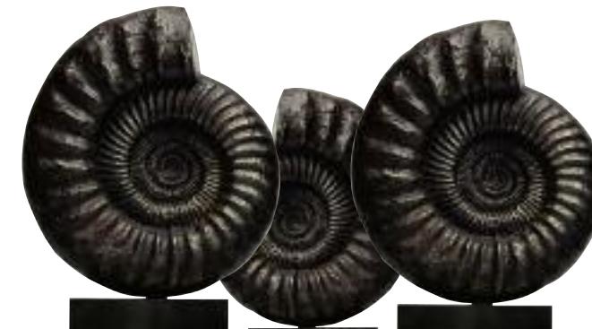
NATURA Rzeźby Spiral Fossils naśladują formę wymarłych morskich stworzeń. XXXX, www.XXXX.com